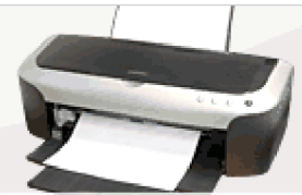
Drukarki i skanery