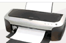
Drukarki i skanery