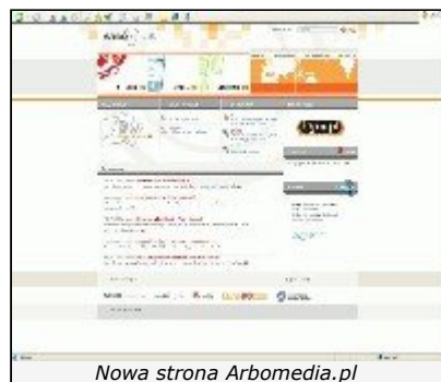
Nowa strona Arbomedia.pl

Różne strony Internetu (25 września 2006)