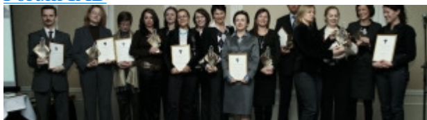
PR Forum / Złote Spinacze